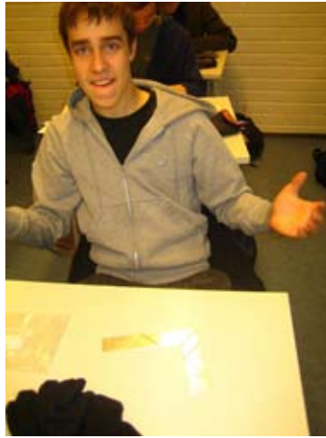
Hei, mä tein sen!

Palaset sopivat lähes täydellisesti toisiinsa, ja mikä oli sopiessa: levytyökeskuksen tarkkuus on niin suuri, että leikatut palaset ovat käy-