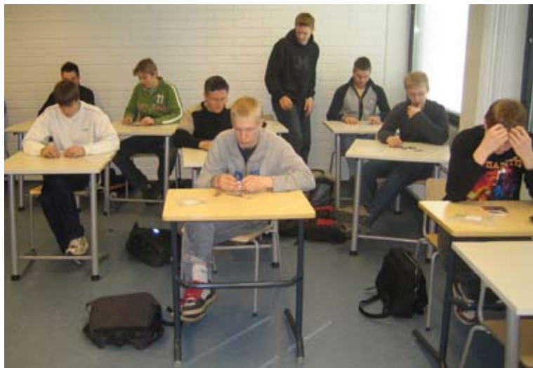
Pojat tangramin äärellä