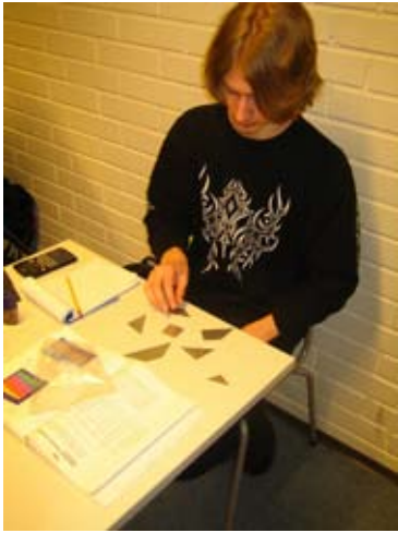
Alkutilanne. Oppilaat saivat palaset irrallisina muovipussissa.

havaintomateriaaleja, joten hedelmällistä yhteiseloä oli hyvä lähteä jatkamaan uudella projektilla: tangramin valmistamisella.