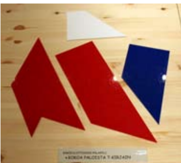
Kuva 3. T-pulma.

Kuuluisa leikkaustehtävä on T-pulma (Kuva 3), jossa T-kirjain on leikattu neljään osaan kuvan osoittamalla tavalla. Sitä on käytetty ensimmäistä kertaa amerikkalaisen kastikkeita valmistavan yrityksen mainoksessa, nimellä ”Teaser”. Pulmassa on vain neljä palaa, mutta T-kirjaimen kokoaminen niistä on yllättävän haastava tehtävä. Syynä tähän on todennäköisesti se, että pyrimme ajattelemaan ja hahmottamaan kuvioita suorakulmaisesti ja symmetrisesti. Epäsymmetrisimmän palan sijoittaminen vinoon, vaatii hetken miettimistä ja kokeiluakin.