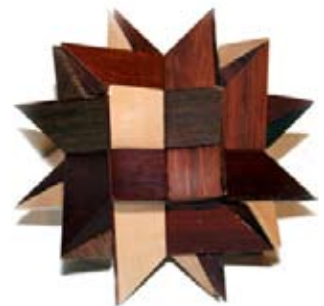
Kuva 5. Lukkiutuva ongelma.

Pulmia ovat myös erilaiset pulma-astiat: miten niihin saadaan neste tai miten se saadaan pois. (Kuva 6). Kuvan esine on