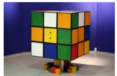
Jättikokoinen Rubikin kuutio.

Tekniikan museossa on esillä yli 1000 mekaanista pulmaa, joista osaa pääsee itse kokeilemaan.