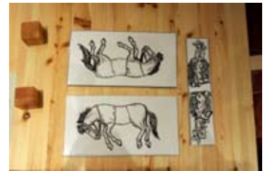
Kuva 1. Ratsastajapulma.

Palapelinä voidaan pitää myös Sam Loydin aikanaan esittämää ratsastajaongelmaa (Kuva 1).