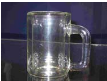
Kuva 6. Kleinin pullo.

Useimpien pulmien ratkaisemisessa on hyötyä matemaattisesta ajattelusta ja geometrisesta hahmottamisesta. Toisaalta mekaanisten pulmien ratkaiseminen kehittää hah-