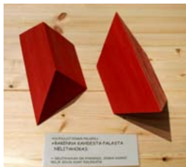
Kuva 4. Kahdesta palasta koottava nelitahokas.

Kolmiulotteisista tilantäyttötehtävistä, palapeleistä, eräs kuuluisimpia on tanskalaisen Piet Heinin vuonna 1936 kehittämät Soma-kuutiot. Soma-paloja on kaikkiaan seitsemän. Jokaisessa palassa kolme tai neljä pikkukuutiota on liitetty toisiinsa eri tavoin lukuun ottamatta liitosta, jossa kuutiot muodostaisivat suoran tangon tai neliön. Paloista voidaan koota iso 3·3·3-kuutio 240 eri tavalla sekä rakentaa lukemattomia muita rakennelmia. Huolimatta siitä, että iso kuutio voidaan koota niin monella tavalla, yhdenkin ratkaisun löytäminen vie aikaa, jos käyttää vain yritys-erehdys -menetelmää. Soma-paloja voidaanankin perustellusti pitää kiinalaisen Tangramin kolmiulotteisena vastineena. Soma-palat ovat saaneet nimensä Aldoux Huxleyn kirjassa Uljas uusi maailma käytetystä huumeesta. Soma-paloilla askartelua on kerran alkuun päästyään vaikea lopettaa.